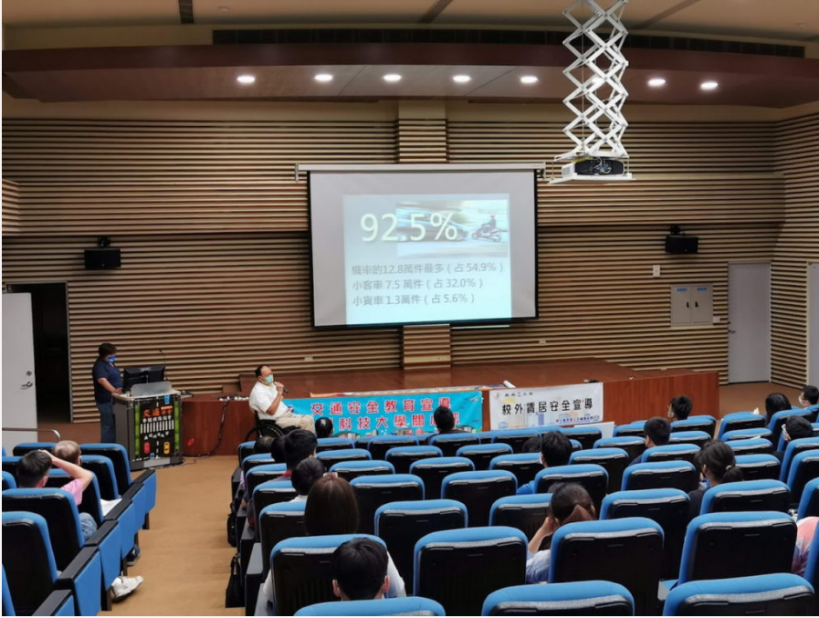
吳鳳科大宣導交通安全辦理「脊髓損傷友人校園分享生命歷程」活動

現場同學們看到脊髓損傷者因為身體的不便，反而更努力的活出自我，讓學生們很感動。吳鳳科大校長蔡宏榮說，台灣地區每年因各種意外而導致脊髓受傷的案例，約有1,200人之多，脊髓一旦受傷會產生四肢癱瘓或下半身癱瘓的後果，因而終生殘疾。傷者又有非常多20歲區間的學生族群，因此由脊髓損傷友人親自分享人生過程中遇到的挫折，克服種種困難，讓學生們見到行動不便者另一面廣闊的天空，這也是對生命教育的一種啟發，期盼莘莘學子都能尊重生命，時時刻刻注意交通安全的重要性。